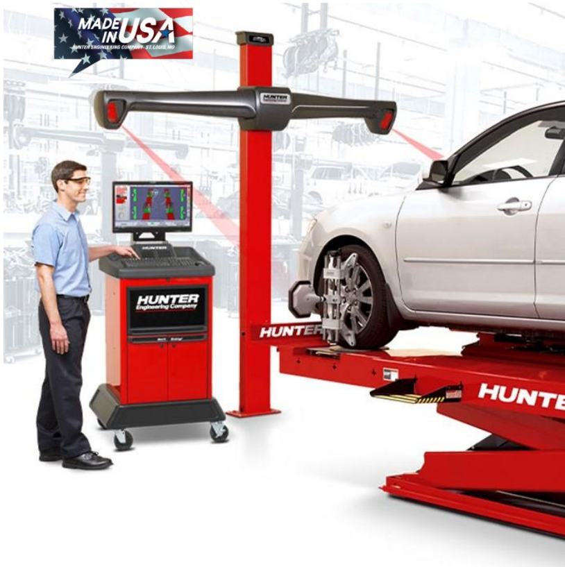
상기 사진에는 옵션 품목이 포함되어 있습니다.